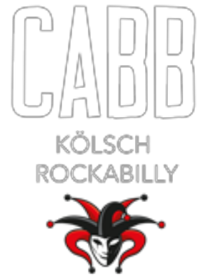
CABB Typo / Logo / Transparent