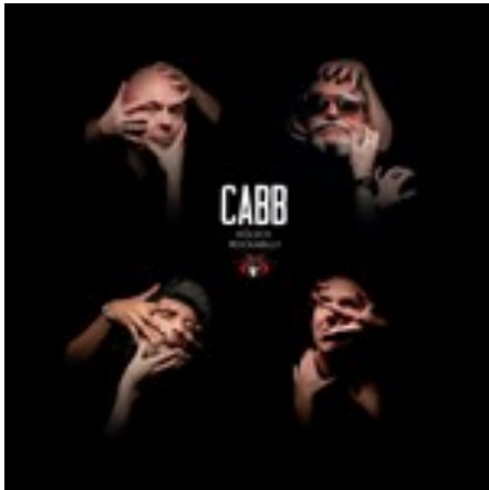
Foto 11 mit Typo