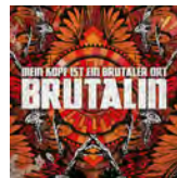
BRUTALIN (LP) 2015