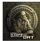
SELBSTMITLEITKULTUR (LP) 2018