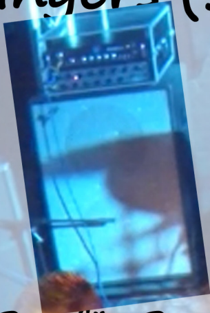
DI Box für Bass