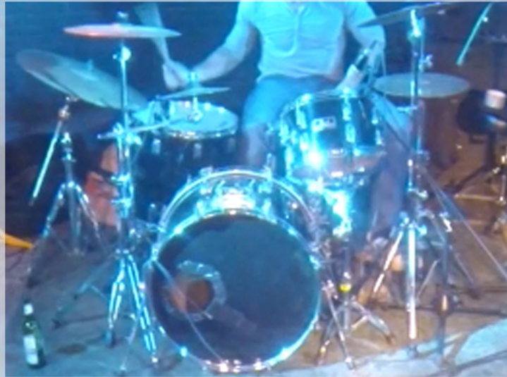
Drum Mikros Bass, 2x Tom, Snare, Overheads