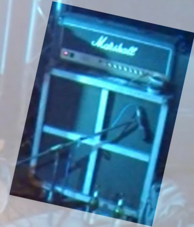
Mikro für Gitarre